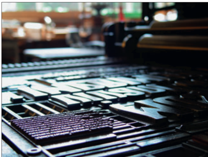
Une composition mêlant caractères en bois et caractères en plomb, placée sur la presse à affiche du musée.

Il faut dire que l'ASBL n'est à peu près pas subsidiée et fonctionne essentiellement avec une poignée de bénévoles et une personne sous contrat APE. Installée depuis