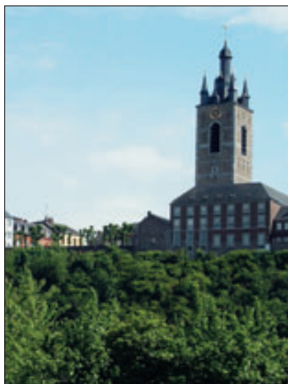
En dehors du musée de l'imprimerie, Thuin abrite d'autres attractions touristiques comme sa vieille ville et son beffroi ou son musée du tramway vicinal.

Avec l'arrivée de l'offset, des photocomposeuses puis de l'informatique, le monde de l'imprimerie a connu un bouleversement extraordinairement rapide. Des catégories entières de machines, outils et accessoires ont été mis au rebut au cours de ces dernières décennies. Une à une, les imprimeries typo ont fermé leurs portes ou ont abandonné le plomb pour le Mac et les flasheuses. Dispersé, le vieux matériel a souvent fini à la ferraille, vendu au poids ou tout simplement donné. Heureusement, quelques initiatives permettent encore de se faire une idée de ce qu'étaient les métiers de l'imprimerie dans un passé pas si lointain.